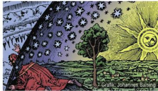
Graphik: Johannes Balsing