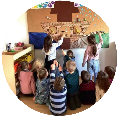
Das Team der Albert Schweitzer Kita Texte

Seit einigen Jahren stellt unser Träger uns einen Koffer mit unterschiedlichen, religionspädagogischen Inhalten und Themen zur Verfügung. Im ersten Halbjahr 2026 steht das Thema „Arche Noah“ im Mittelpunkt. In den einzelnen Kita- Gruppen wird „Arche Noah“ auf verschiedene Weise aufgegriffen und altersgerecht erarbeitet.