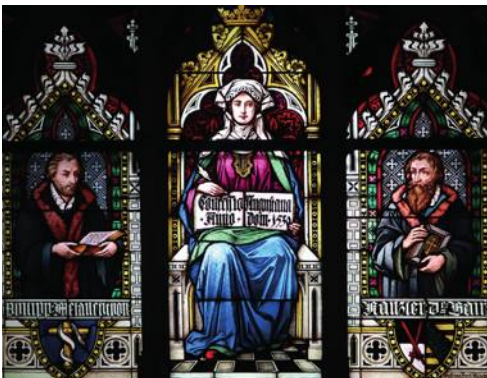
Bild: Joachim Schäfer: Artikel Augsburger Bekenntnis, aus dem Ökumenischen Heiligenlexikon